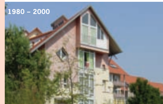
1980 – 2000