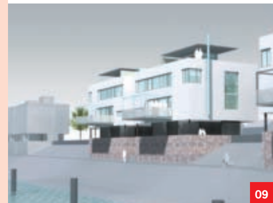
v Zukünftige Bebauung am Luitpoldhafen, Parkinsel