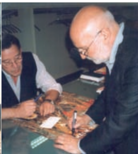
Berühmte Künstler hautnah: Arman gibt ein Autogramm