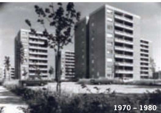
1970 – 1980

Neben den Neubauaktivitäten gewinnt die Anpassung bereits bestehenden Wohnraums an moderne Standards immer mehr an Bedeutung. Zu den ersten Projekten dieser Art gehörte der so genannte Rosenhof in der Blücherstraße. Im Rahmen der Hemshofsanierung rückte die Erneuerung einer gewachsenen Wohnstruktur in den Fokus: Bei der Planung des Integra-Projektes wurden erstmals in Zusammenarbeit mit den zukünftigen Bewohnern Gemeinschaftsräume wie eine Spielwohnung für Kinder geplant. In dieser Zeit entstanden auch die ersten Auftragsbauten für die Stadt wie zwei Seniorenwohnheime und eine Kindertagesstätte.