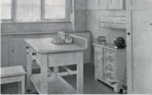
1920 – 1930