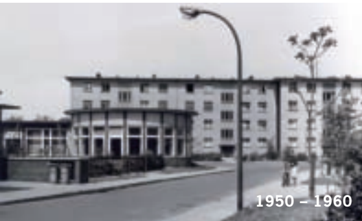
1950 – 1960