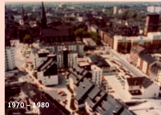
1970 – 1980

nahmen fit für die Zukunft und für die nächsten Generationen gemacht. Mit den Bürogebäuden lu-teco und lu-teco 2 hat die Passivhausbauweise neben dem Wohnungs- auch im Gewerbebau Anwendung gefunden. Eine Fotovoltaikanlage mit einer Gesamtfläche von 10.500 Quadratmetern liefert Strom aus der Sonne. Mit der Erschließung des Rheinufer Süd und der Parkinsel eröffnet die GAG ein eigenes Kapitel der Stadtentwicklung. Sie betritt dort auch Neuland in Sachen ressourcenschonendes Bauen und leistet so einen weiteren Beitrag dazu, Ludwigs-hafen als heimliche Hauptstadt der Energieeffizienz zu bestätigen.