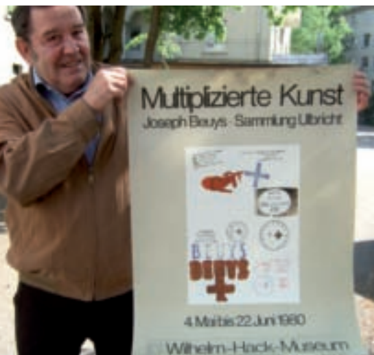
Gesammelte Kunstgeschichte: Viele Ausstellungspakete des Wilhelm-Hack-Museums befinden sich in Willi Kricks Besitz