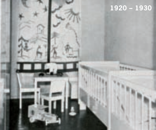
^ Musterküche und Kinderzimmer in der Westendsiedlung