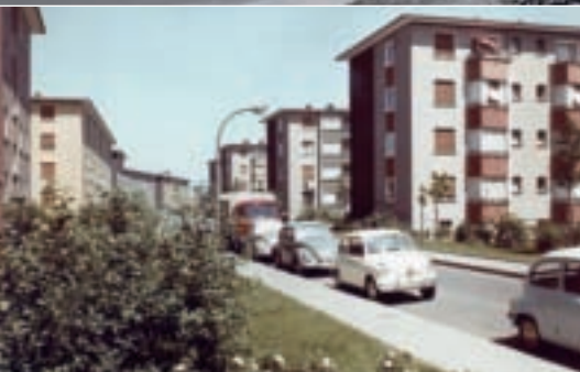
v Punkthäuser in der Pflingstweide