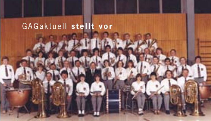
Vierter von links in der oberen Reihe beim Musikverein Hambrücken