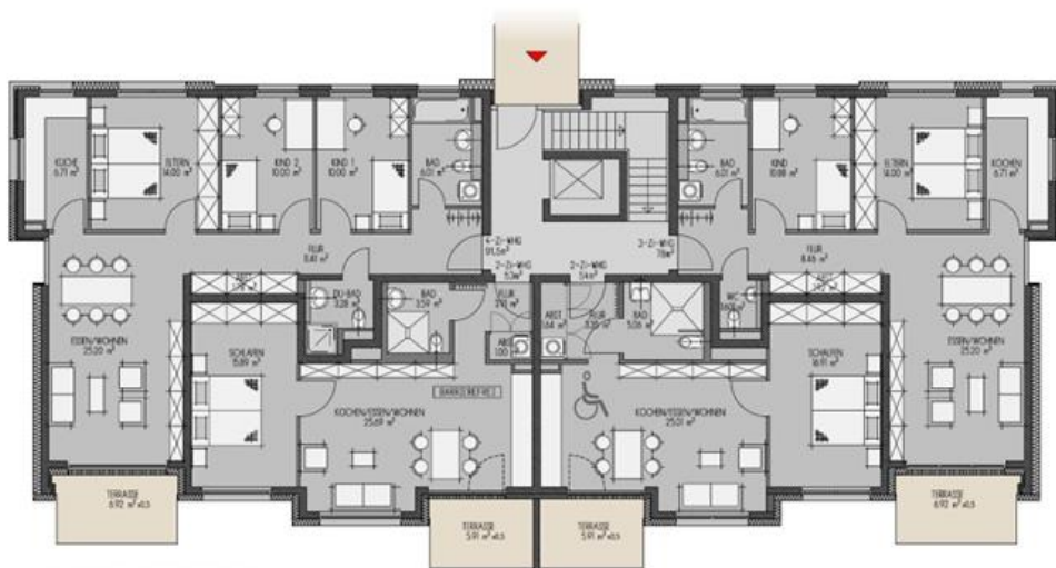
Haustyp A Grundriss Erdgeschoss

Eckdaten Haus A: 2 Geschosse zzgl. Dachgeschoss 10 Wohnungen 767 m 2 Wohnfläche Aufzug vorhanden