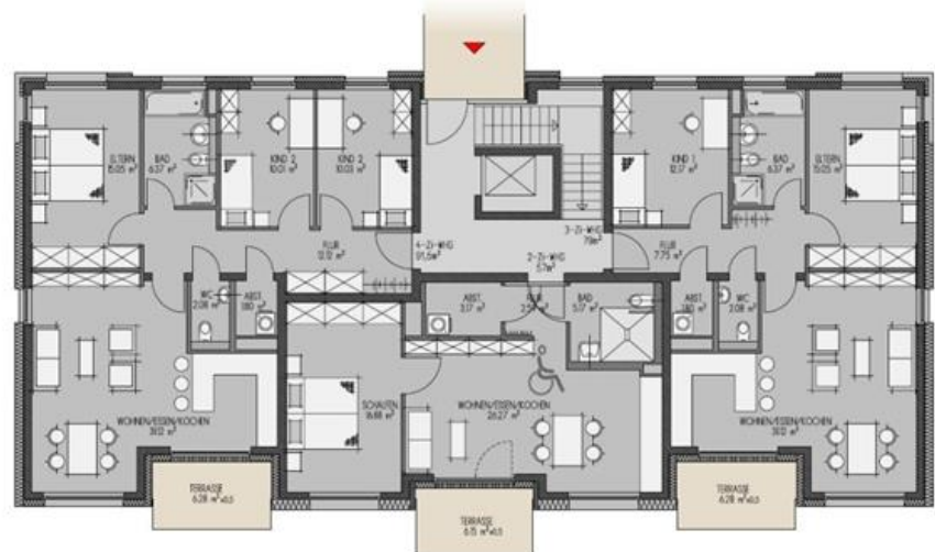
Haustyp B Grundriss Erdgeschoss

Eckdaten Haus B: 2 Geschosse zzgl. Dachgeschoss 8 Wohnungen 645 m 2 Wohnfläche Aufzug vorhanden